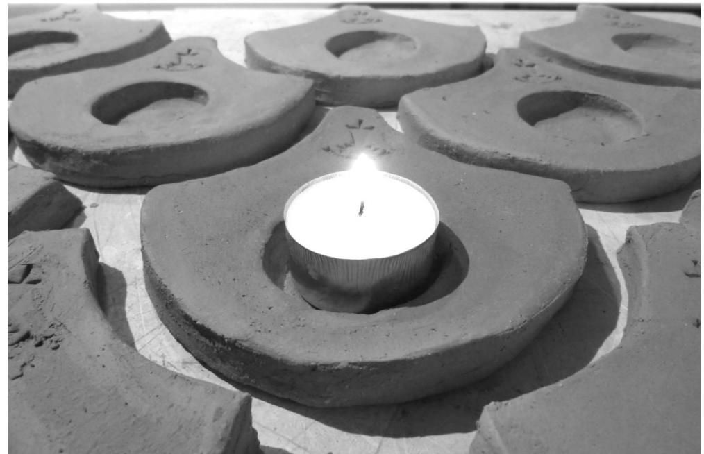
Kerzenleuchter in der Form der alten Bodenfliese vom Kloster Hiddensee

- Die Selbsthilfegruppe Suchtabhängiger trifft sich 14tägig im Pfarrhaus