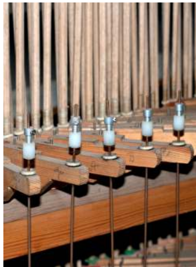
Wippenkoppel in der Orgel auf Hiddensee