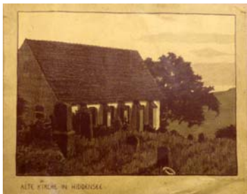
„Alte Kirche in Hiddensee“ Lithografie von J.Fikentscher um 1903.

Gemeindekreise: - Der Frauen-/Seniorenkreis trifft sich dienstags von 14.30 Uhr bis 16 Uhr: (Kein Treffen am Di., 03.10, Di., 24.10. und Di., 31.10.) in Kloster: 10.10., Mi., 01.11. (!!), 14.11. und 28.11. in Neuendorf: 26.09., 17.10., 07.11. und 21. 11.