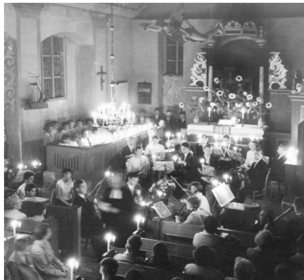
„Cantate Domino – Singt dem Herrn“ Seit 1962 gehören die Musici Jenenses fest zum Hiddenseer Sommer.